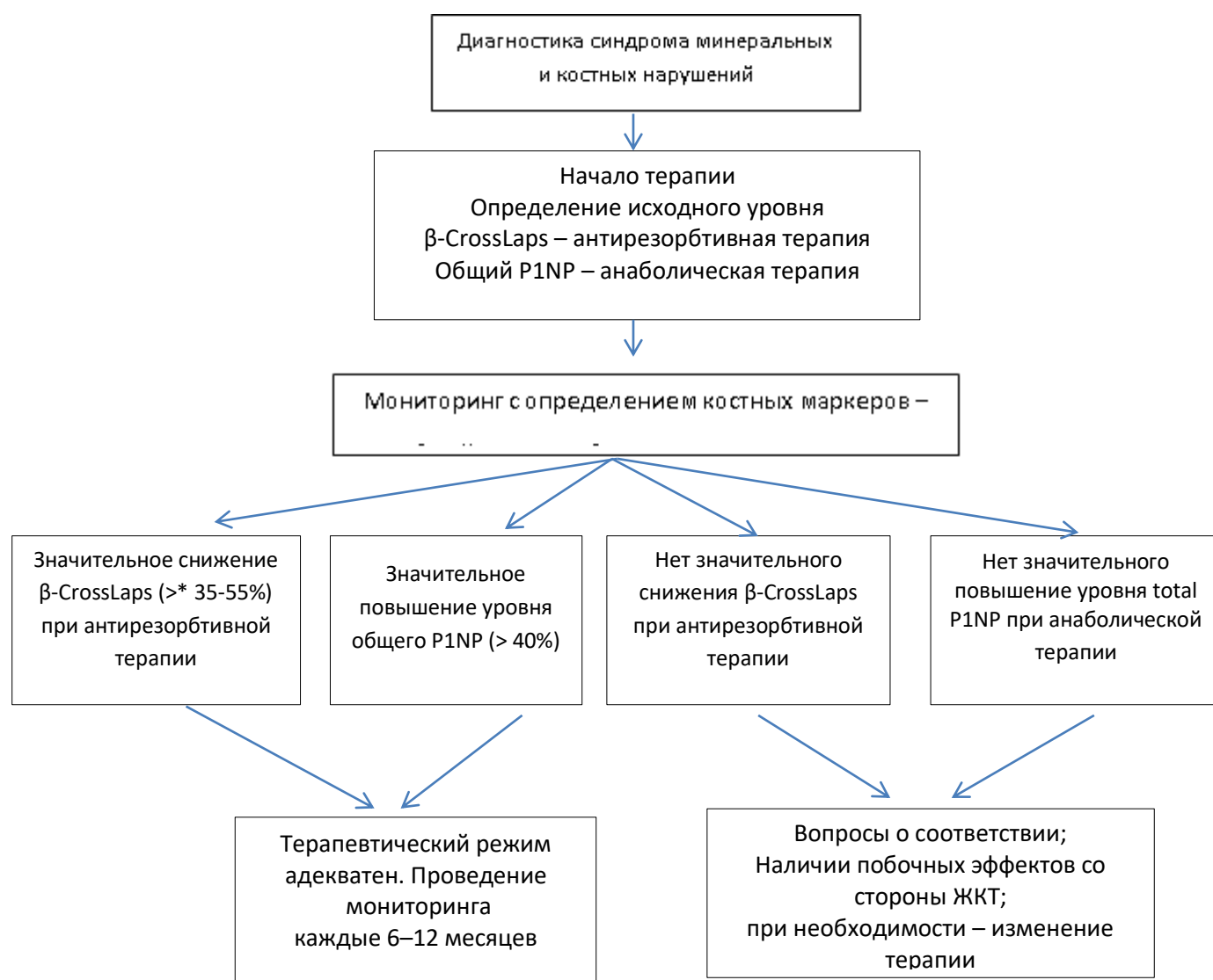
Рисунок 1. Алгоритм лабораторного мониторинга пациентов с костно-минеральными нарушениями и остеопорозом

При использовании гормон-заместительной терапии (HRT) уровни β-CrossLaps должны снижаться, по крайней мере, на 35%; антирезорбтивная терапия, отличная от HRT, может быть признана эффективной лишь при снижении уровней β-CrossLaps, как минимум, на 55% (рисунок 1).