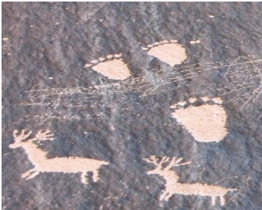
Рис. 6. Стопы.