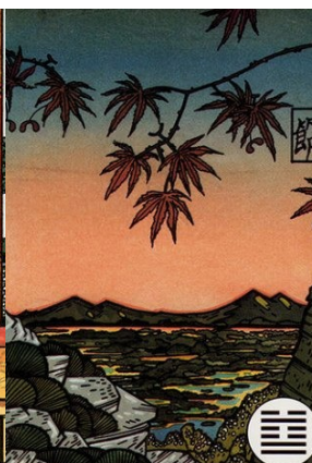
Рис. 3. №11 - Тай.